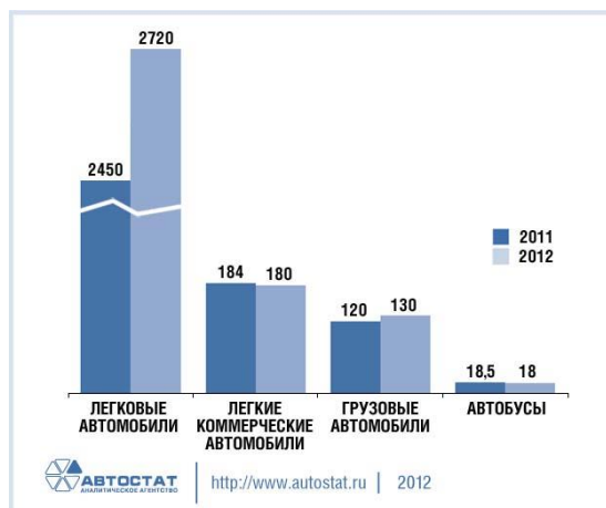
Рисунок 2 – Прогноз развития автомобильного рынка

Иллюстрации каждого приложения обозначают отдельной нумерацией арабскими цифрами с добавлением перед цифрой обозначения приложения. Например, Рисунок А.3. При ссылках на иллюстрации следует писать «... в соответствии с рисунком 2» при сквозной нумерации и «... в соответствии с рисунком 1.2» при нумерации в пределах раздела. Сокращения слова рисунок при ссылке в тексте недопустимы.