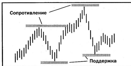
Рисунок 1.1 – Уровни поддержки и сопротивления

Рисунки каждого приложения обозначаются отдельной нумерацией арабскими цифрами с добавлением перед цифрой обозначения приложения. Например: Рисунок А.3.