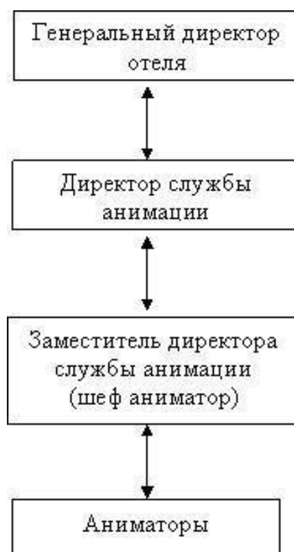
Рисунок 2. Структура менеджмента анимации