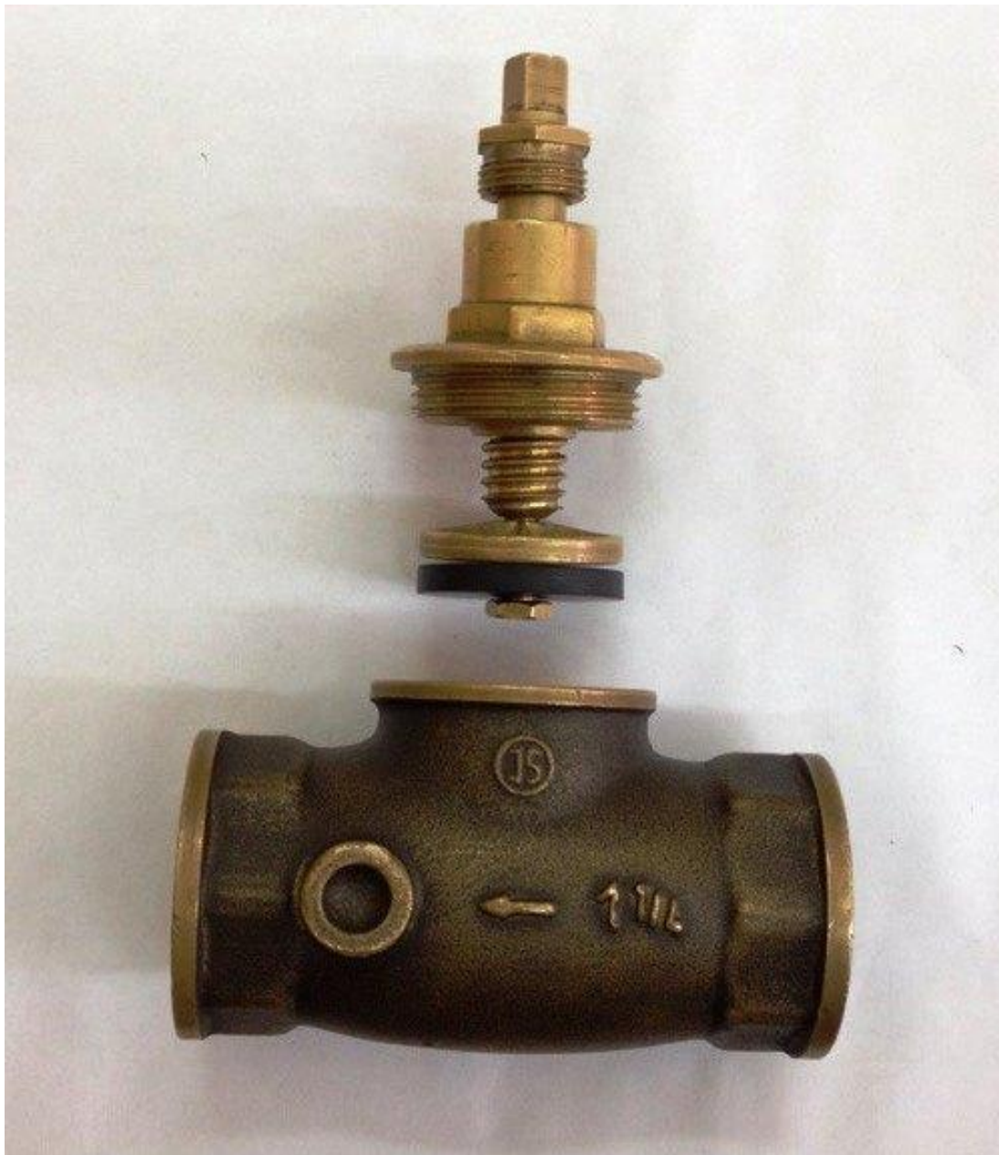
Рис.3. Пример сборочной единицы.

Выполнить эскизы (ручное эскизирование) деталей, входящих в сборочную единицу. Назначить размеры и произвести необходимые измерения. Выпустить чертеж общего вида заданной сборочной единицы. Выполнить спецификацию.