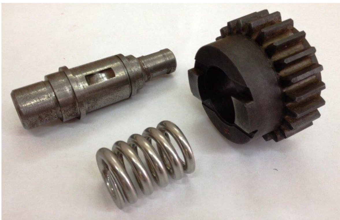
Рис. 2. Фото одного из вариантов вала, шестерни, пружины.

Привести в соответствие с существующими стандартами