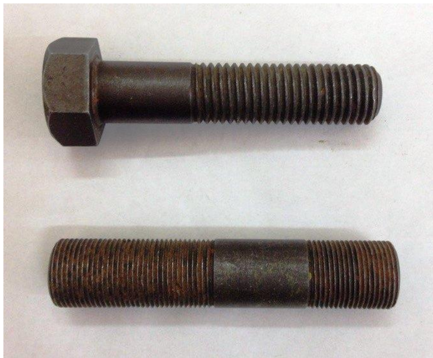
Рис.1. Фото одного из вариантов резьбовых крепежных деталей.

Выполнить эскизы резьбовых крепежных деталей (болт, шпилька). Выполнить измерения резьбы. Скомпоновать, рассчитать и выпустить сборочный чертеж резьбовых соединений для заданных деталей с привлечением справочных данных по резьбам, резьбовым деталям и резьбовым соединениям (стандарты ЕСКД).