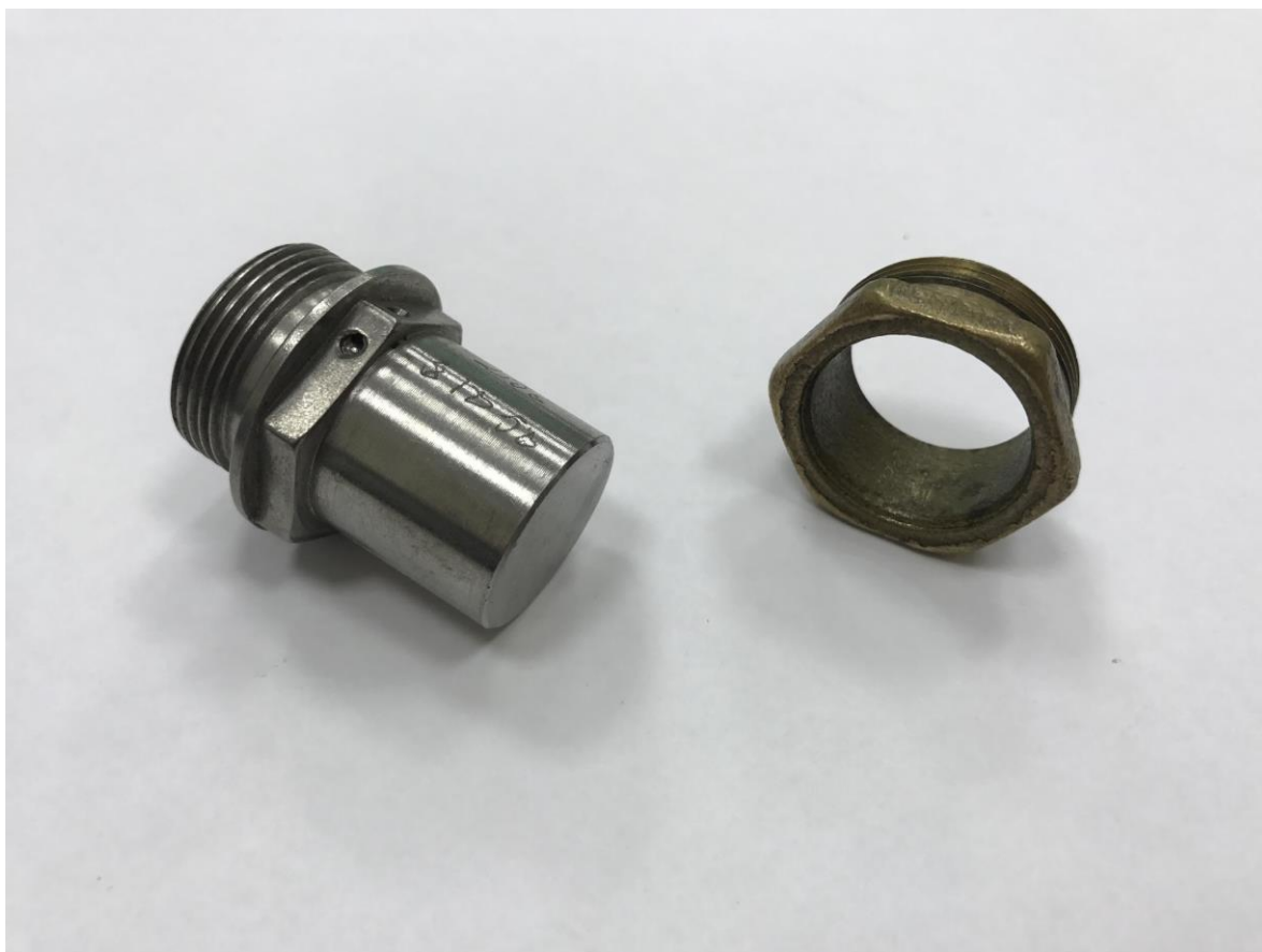
Рис.4. Пример контрольного задания

Выполнить эскиз одной из деталей сборочной единицы.