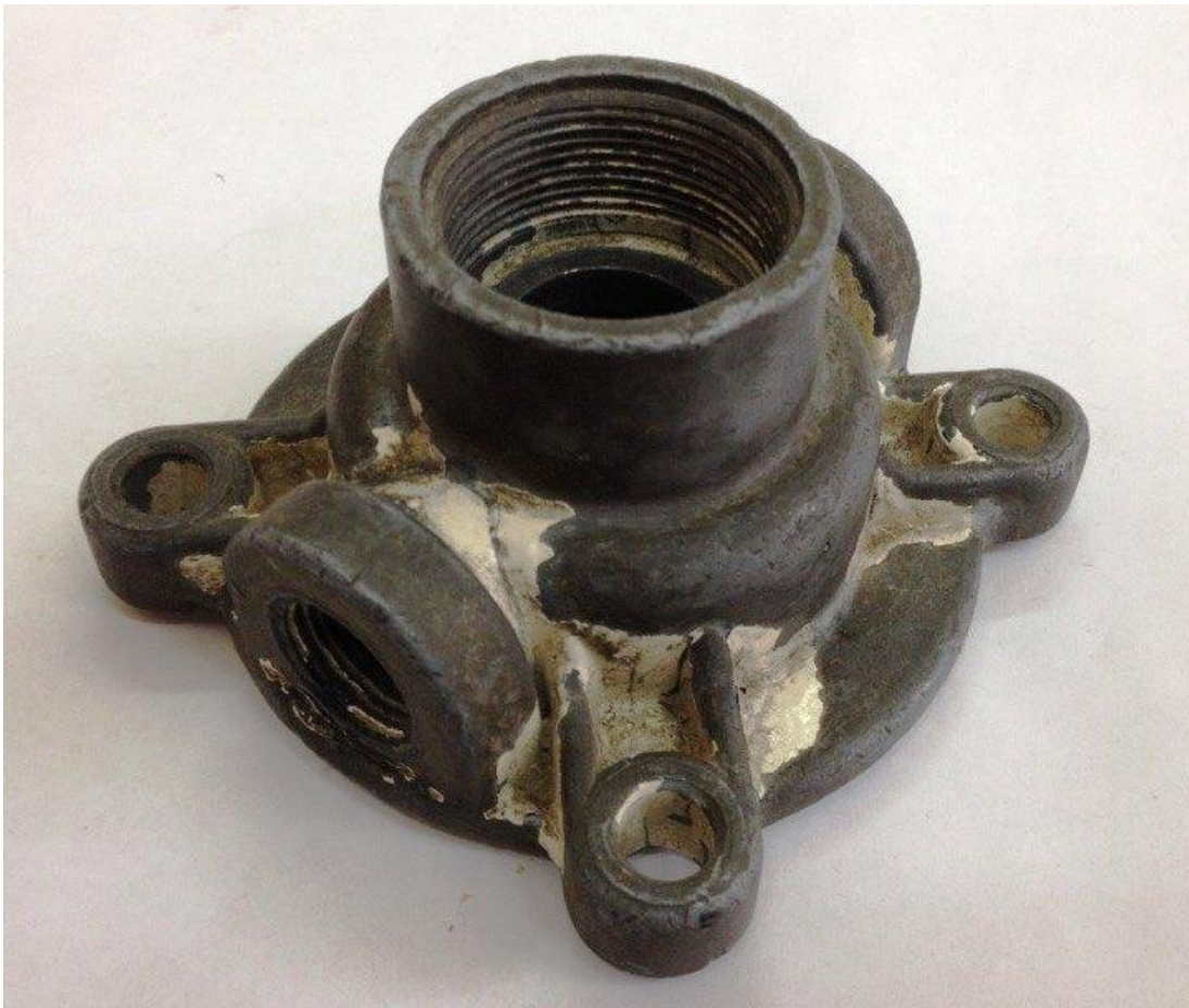
Рис. 5. Пример зачетного задания.

Выполнить эскиз машиностроительной детали средней сложности. Выбрать необходимое и достаточное количество изображений. Скомпоновать эскиз и выполнить изображения в проекционной связи. Назначить размеры. Произвести измерения. Проставить размерные числа.