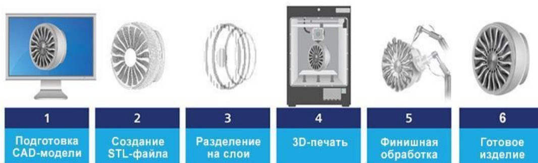
Рисунок 1 – Общая схема аддитивного производства 7 .

«По оценкам PWC, в 2015 году около 7% промышленных компаний использовало 3D-принтеры для выпуска конечной промышленной продукции и еще 7% компаний нуждалось во внедрении данной технологии» 6 . 3D-принтинг связан с концепцией децентрализованного (аддитивного) производства (distributed manufacturing). Общую схему аддитивного производства можно изобразить в виде последовательности, показанной на рисунке 1.