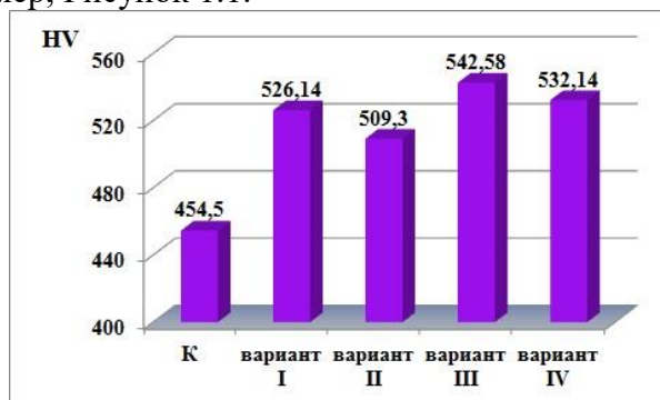
Рисунок 1 - Влияние материала катода имплантера на нанотвердость

Если рисунок один, то он обозначается «Рисунок 1». Слово «рисунок» и его наименование располагают посередине строки. Допускается нумеровать иллюстрации в пределах раздела. В этом случае номер иллюстрации состоит из номера раздела и порядкового номера иллюстрации, разделенных точкой. Например, Рисунок 1.1.