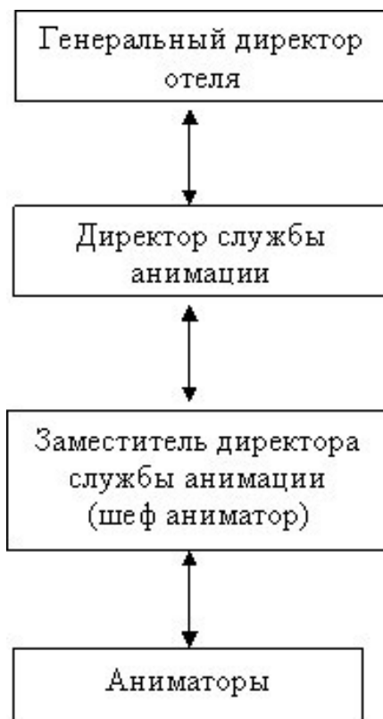
Рисунок 2 – Структура менеджмента анимации