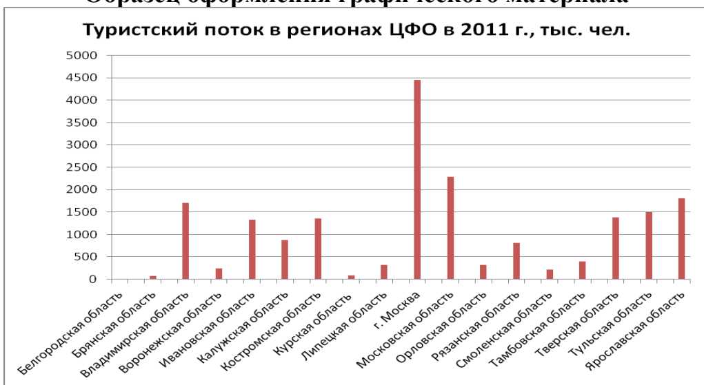
Рисунок 1 – Распределение туристского потока по областям Центрального федерального округа