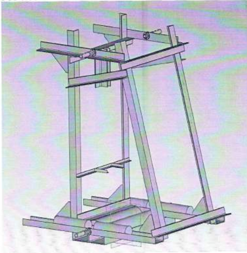
Рисунок 1. Общий вид Сборки Клет